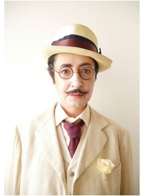
Dominique Gonzalez-Foerster, M.2062 (Promenade with Aschenbach), apparition, Manifesta 10 - St Petersburg, 2014. Courtesy The State Hermitage Museum. Photo : Egor Rogalev ©Dominique Gonzalez-Foerster/ADAGP.