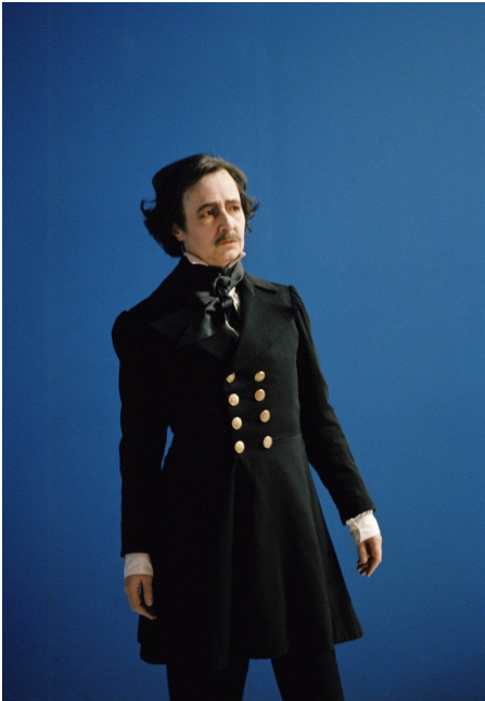
Dominique Gonzalez-Foerster, M.2062 (Edgar Allan Poe), apparition, Palais de Tokyo, Paris, 2013. Courtesy de l'artiste Dominique Gonzalez-Foerster. Photo : Giasco Bertoli ©Dominique Gonzalez-Foerster/ADAGP.