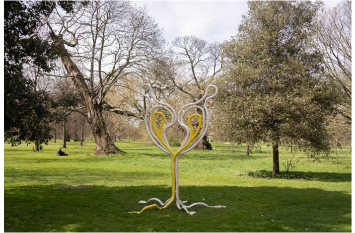
Dominique Gonzalez-Foerster et Paul B. Preciado, In remembrance of the coming alien (Alienor), 2022. Statue en acier peint. Vue d'exposition, Alienarium 5 (Serpentine South, 14 avril - 4 septembre 2022).

Être à l'intérieur d'un de ces espaces incite à ressentir la différence – un nouveau dénouement. La description que donne Gonzalez-Foerster de l'art comme environnement ou enveloppe (« quelque chose qui entoure, plutôt que quelque chose qui vous fait face ») agit par-delà les frontières. De plus en plus, elle montre comment les frontières entre des espaces délimités enflent ou se brisent : contenu et assistance, intérieur et extérieur, hôte et étranger. Alienarium 5 s'étend hors de la Serpentine Gallery vers l'environnement immédiat, et au-delà. Les œuvres de l'exposition peuvent être vues depuis l'extérieur du bâtiment, et l'une d'entre elles aperçue seulement à travers les petits carreaux de verre des anciennes portes-fenêtres. Certains de ces carreaux ont été obturés, d'autres permettent au public de jeter un œil. En bas des portes se trouvent quelques vitres transparentes – accessibles à un escargot ou à un renard qui vit dans le parc. Il y a aussi des « transmissions » sonores que l'on peut recevoir depuis certains endroits de Hyde Park. Les gens peuvent les écouter en marchant vers la galerie, ou après, en repartant. À l'extérieur de la galerie, les transmissions d' Alienarium 5 viennent de l'espace intersidéral ; dans la galerie, au cœur de l'exposition, le monde se presse sur les murs de Metapanorama .