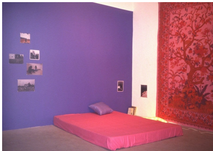
Dominique Gonzalez-Foerster, Nos Années 70 (Chambre), Environnement. Vue d'exposition « Le Dimanche de la vie », Gio Marconi, Milan, Italie, 1992.

exerce une pression : elle peut agir à l'intérieur. La pièce devient un moyen d'accéder à une autre expérience. Chacune est un vortex.