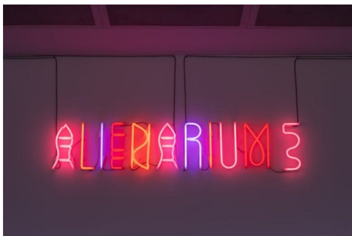
Dominique Gonzalez-Foerster avec John Morgan studio, Alienarium 5 (Neon), 2022. Vue d'exposition, Alienarium 5 (Serpentine South, 14 avril - 4 septembre 2022).