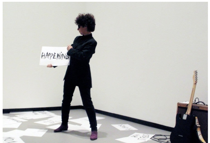
Dominique Gonzalez-Foerster, M.2062 (Bob), apparition, Fondation Louis Vuitton, Paris, 2014. Courtesy Fondation Louis Vuitton Paris. Photo : Giasco Bertoli. © Dominique Gonzalez-Foerster/ADAGP.