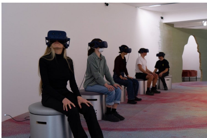
Dominique Gonzalez-Foerster, Alienarium, 2022. Réalité virtuelle multi-utilisateurs, 10 minutes. Produite par VIVE Arts. Développée par Lucid Realities. Vue d'exposition, Alienarium 5 (Serpentine South, 14 avril - 4 septembre 2022).