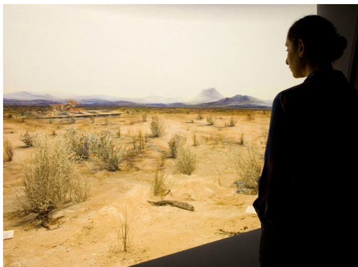
Dominique Gonzalez-Foerster (avec Joi Bittle), chronotypes & dioramas , 2009. Vues d'exposition (détails), Dia at the Hispanic Society, 23 septembre 2009 – 18 avril 2010.

Quand on m'a invitée à réfléchir et à écrire sur son travail, c'est le mouvement lui-même qui m'a le plus intéressée, la façon dont ce champ considérable suggère une expédition ou une exploration, une mission, le tourisme. J'ai commencé au seuil de l'univers et j'ai parcouru des échelles à travers une séquence d'espaces circonscrits créés par Gonzalez-Foerster, puis j'ai pénétré dans le corps.