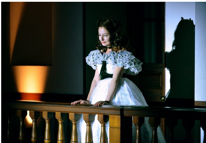
Dominique Gonzalez-Foerster, M.2062 (Scarlett), apparition, Parasophia, Kyoto, 2013. Courtesy de Parasophia Office, The Museum of Kyoto, Japan. Photo : Takahiro Mitsukawa ©Dominique Gonzalez-Foerster/ADAGP.

J'ai regardé des vidéos de chacune de ces œuvres les unes après les autres – un relais rapide d'apparitions, changeant de costume, de scénographie, de musique et de persona d'un instant à l'autre, logiquement impossible dans la vie réelle. En les voyant à la suite, j'ai remarqué que de nombreuses apparitions attirent l'attention sur leur propre théâtralité : les accessoires et les rideaux en velours, les systèmes d'éclairage et les bandes-son qui nous submergent. Il y a des sequins et des paillettes, il y a un visage maquillé au néon. Mais le personnage au centre de tous ces événements mis en scène m'est apparu, peut-être à rebours de toute logique, comme une personne exceptionnellement mesurée – je dirais même presque maîtresse d'elle-même. L'être de Gonzalez-Foerster se déplace, ou est déplacé, posément, qu'elle soit une répliquante de Blade Runner sur la scène d'un concert pop ou Faye Dunaway en rose bonbon, assise devant un échiquier, jouant seule.