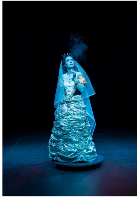
Dominique Gonzalez-Foerster, M.2062 (Lola Montez in Berlin), apparition, 2014. Courtesy Gallery Esther Schipper. Photo : Andrea Rossetti ©Dominique Gonzalez-Foerster/ADAGP.