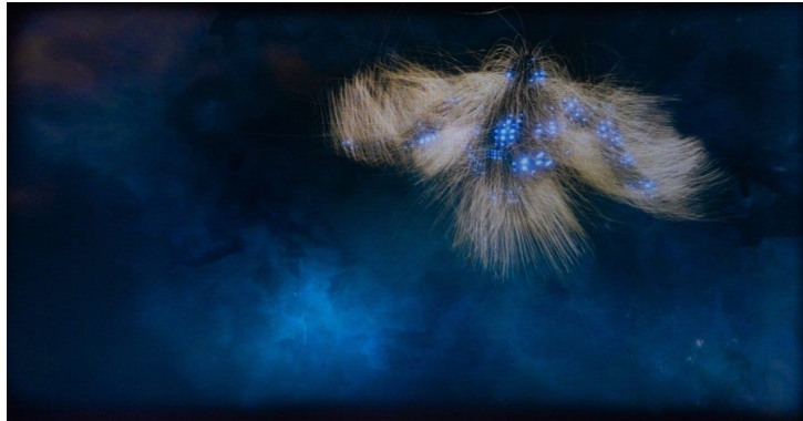
Dominique Gonzalez-Foerster, Holorama 5 (LoieFullerforever), 2022. Illusion holographique. Son: Julien Perez/Exotourisme, 14 minutes. Produit par VEGA foundation. Développé par Virtual Lightning BoxVue d'exposition, Alienarium 5 (Serpentine South, 14 avril - 4 septembre 2022).

J'ai regardé tout autour, à travers le voile ou le foulard ou la bulle qui m'enveloppait. Encore de l'espace, d'autres étoiles scintillantes. Puis il y a eu un son pétillant.