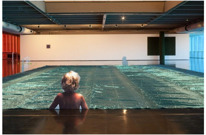
Dominique Gonzalez-Foerster, Untitled (Marilyn), 2015. Images imprimées sur aluminum, tissu. Temporama, vue d'exposition, Museu de Arte Moderna, Rio de Janeiro, Brazil. Photo : Pat Kilgore ©Dominique Gonzalez-Foerster/ADAGP.

...nous consomons et participons à l'extraction alors même que nous critiquons la crise de la consommation et de l'extraction.