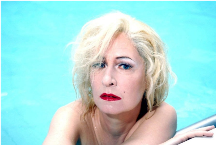
Dominique Gonzalez-Foerster, Untitled (Marilyn), 2015. Temporama, Museu de Arte Moderna, Rio de Janeiro, Brazil. Photographie. Photo : Giasco Bertoli. ©Dominique Gonzalez-Foerster/ADAGP.

accordé au travail humain. « Pourquoi est-il plus important de penser à l'art que de prendre soin des plantes et des êtres vivants. [...] En quel sens l'art ajoute-t-il quelque chose à la biodiversité ou bien la menace-t-il ? »