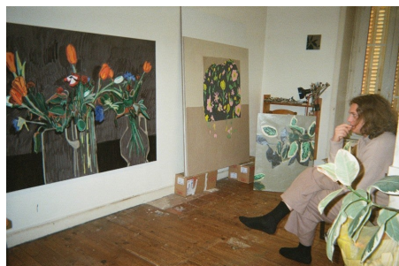
Vue de l'atelier d'Olga Boudin, Lacelle, 2023.