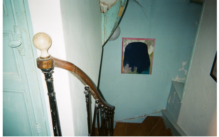
Tom Terrieu, sans titre , 2020. Vue de la maison, Fossile Futur, Meymac, 2023.