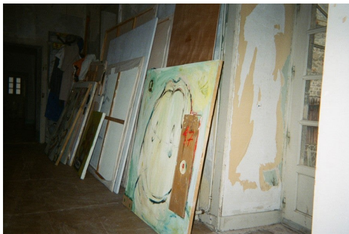
molten_cOre (Baptiste Pérotin & Lucas Hadjam), leandoer19(Q) , 2023. Vue de la maison, Fossile Futur, Meymac, 2023.

Simon est designer. Depuis quelques années, il développe des outils afin de faciliter la communication en groupe, des dispositifs de parole coorganisés dans un respect mutuel. Il m'explique qu'il avait commencé à réfléchir à toute une série d'objets, de contenus et de dispositifs en open source découverts en arpentant divers lieux collectifs. Lever un doigt, un second ou un troisième pour définir sa place dans l'ordre de prise de parole, voter de manière non binaire pour rendre des avis plus diffus et nuancés, etc. Simon développe actuellement un prototype de jeu de société qui regroupe tous ces dispositifs pour permettre à des collectifs, ou tout autre type d'institutions curieuses, de comprendre les rapports de domination qui peuvent s'installer lors de réunions ou de débats. Ces méthodes de parole collective se sont mises en place dans le quotidien de la maison, où elles continuent d'être expérimentées, afin que chaque habitant-e trouve son propre rythme au sein du groupe, son équilibre et sa participation. En somme, des dispositifs ouverts grâce auxquels des personnes qui n'arrivent pas à trouver leur place dans des espaces de travail collaboratif puissent y parvenir plus aisément. J'existe en parlant de vous. J'existe avec et à travers vous.