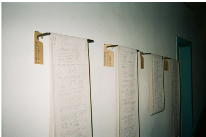
Dispositif informatif conçu et réalisé par Simon Dubedat et Léa Chaumel. Vue de l'entrée, Fossile Futur, Meymac, 2023.