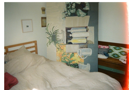
Vue de la chambre d'Olga Boudin, Lacelle, 2023.