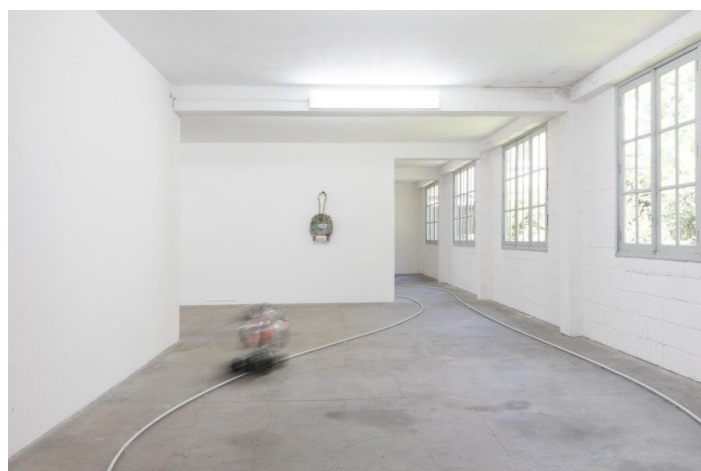
Martin Kersels, vue de l'exposition "Mood Ring", du 2 juillet au 9 septembre 2022, Treignac Project, Treignac.