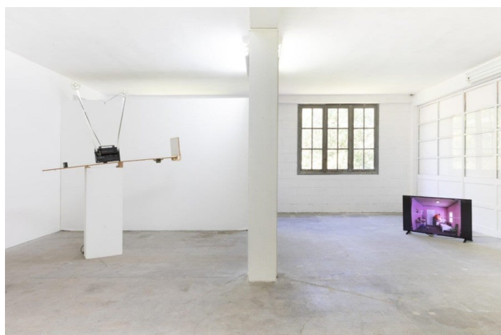
Martin Kersels, vue de l'exposition "Mood Ring", du 2 juillet au 9 septembre 2022, Treignac Project, Treignac.