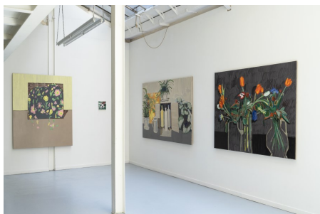
Olga Boudin, Vue de l'exposition "Faire Fleurs", rue du Docteur Potain, Paris, 2023.