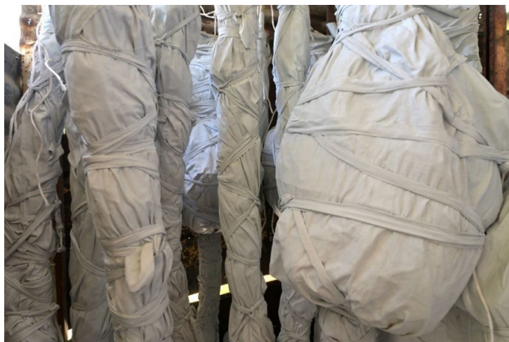
Christian Bertin, La Jungle (cette foule qui ne sait pas faire foule) , 2025. Installation. Régimes de bananes séchées, tissus, colle, peinture. Dimensions variables. © ADAGP. Photo : Robert Charlotte.