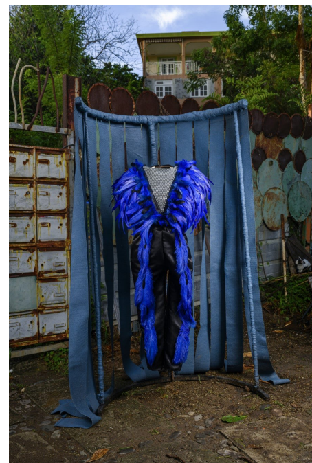
Christian Bertin, Grands Jipons et Matadors de Juan de Pareja , 2025. Technique mixte ; tissu, métal, plastique. 208 x 115 x 70 cm. © ADAGP. Photos : Robert Charlotte.

Une scène issue de la haute culture européenne se voit ainsi réécrite avec une nouvelle distribution de personnages, chacun d'entre eux incarnant l'agentivité que l'on arrache à l'ombre.