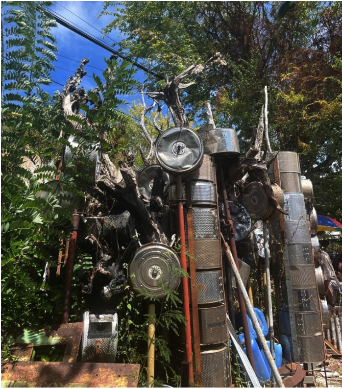
Christian Bertin, Les Lavandières , 2025. Installation (en cours). Pièces de machines à laver, métal, plastique, blocs de béton, caoutchouc, peinture. Dimensions variables. Vue de l'atelier de l'artiste, février 2024. © ADAGP. Photo : Skye Arundhati Thomas.