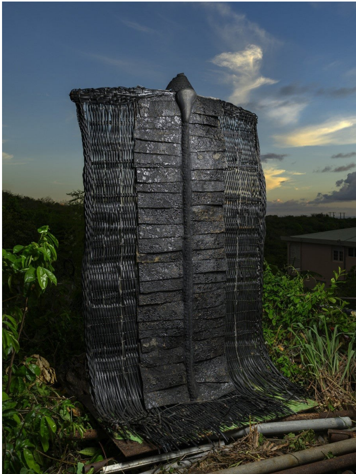
Christian Bertin, La Chambre Noire , 2025. Caoutchouc, pneu et selle de bicyclette, blouson en cuire usagé, fils électriques tréssés, tissus. 220 x 123 cm. © ADAGP. Photo : Robert Charlotte.

La départementalisation de la Martinique devait se traduire par l'octroi de droits à la population de l'île ; plus précisément, par l'alignement de leur statut sur celui des citoyen-nes de la métropole : le même droit du travail, la semaine de quarante heures. Mais l'infrastructure de plantation persista et, deux ans après la départementalisation, une grève générale éclata. Dans la partie la plus septentrionale de l'île, à Basse-Pointe – où, encore aujourd'hui, s'étendent de vastes exploitations aux allures de plantations et où Césaire fit également ses classes primaires – l'administrateur blanc de l'habitation Leyritz fut retrouvé mort, poignardé à trente-six reprises. Seize ouvriers, noirs et indiens, furent arrêtés et placés en détention provisoire pendant trois ans. En 1951, ils furent transférés à Bordeaux, ancien port négrier, où se déroula leur procès retentissant. Dans leurs plaidoiries, les onze avocats de la défense maintinrent une rhétorique résolument politique. Pour finir, les seize furent acquittés ; jamais aucun d'entre eux ne fit de dénonciation.