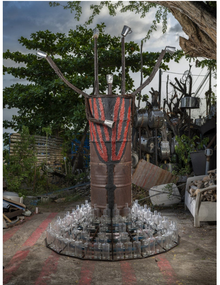
Christian Bertin, Dlo Monté mòn , 2025. Métal, bougies, bouteilles en verre, peinture. Hauteur : 290 cm. © ADAGP. Photo : Robert Charlotte.