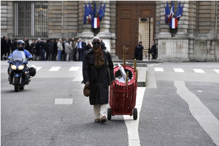
Christian Bertin, Li Diab Là , 2009, performance, Paris. © ADAGP. Photo : Luc Jennepin.

destinée aux élèves défavorisé-es. Tous portaient une attention soutenue à la culture, à l'art, et à leur diffusion. Alier aimait à dire : « La chance de la Martinique, c'est le travail des Martiniquais Z . »